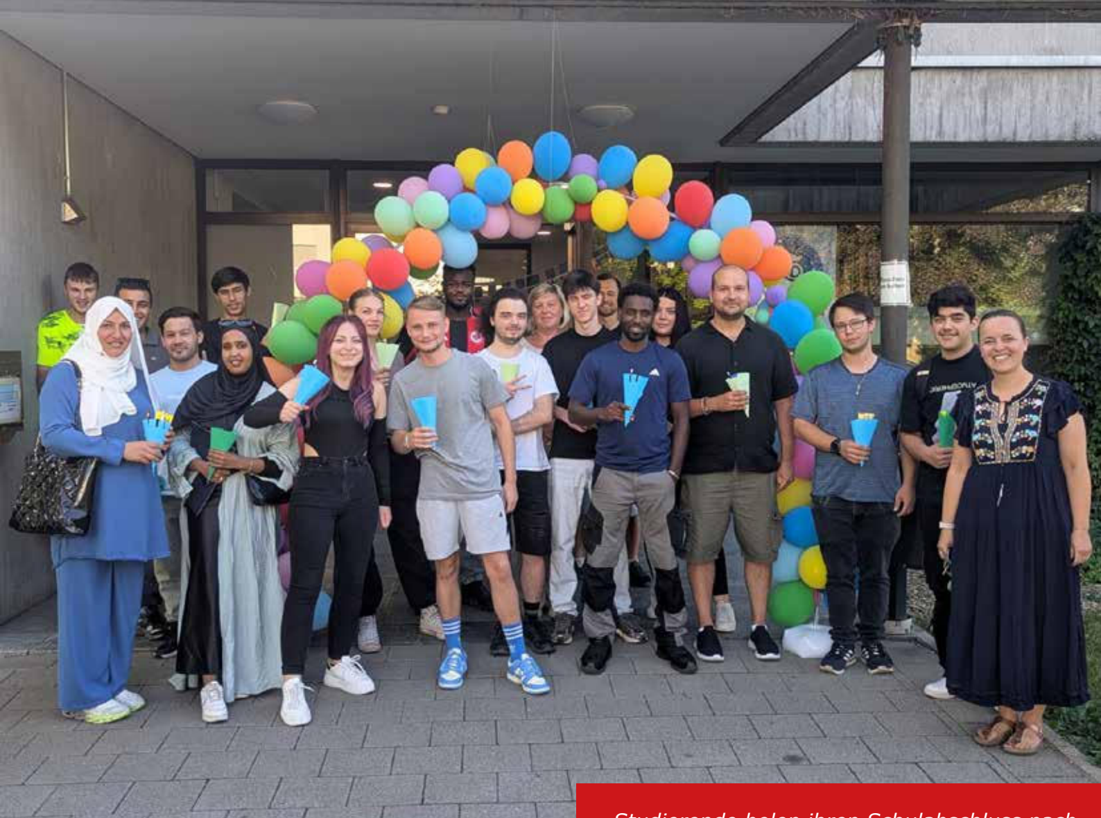
Studierende holen ihren Schulabschluss nach

Es seien auch Schüler austausche mit Workshops zum Lernen mit digitalen Medien an den Partnerschulen geplant.