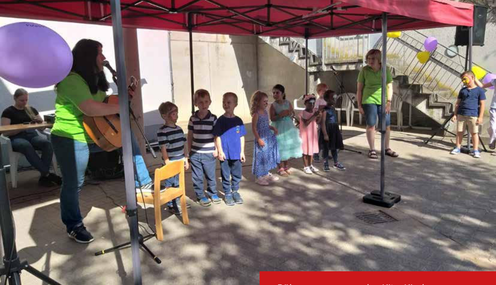
Bühnenprogramm der Kita-Kinder